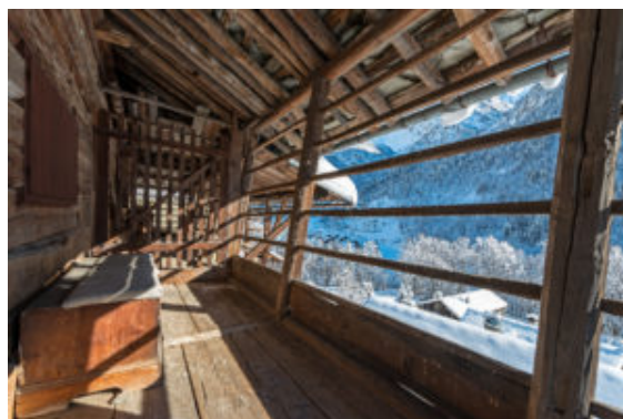
Alagna, paradiso dello sci free ride

L'alta cucina in quota ha un indirizzo ben preciso anche se in quasi tutte le località più glamour delle Alpi oramai vanno di moda festival dedicati a un pubblico gourmet. L'Alta Badia è meta d'elezione: qui infatti vi è il più alto numero di cucine stellate in quota. E, proprio in questi luoghi, l'inizio della stagione è celebrato con la gara di Coppa del Mondo sulla pista della Gran Risa a La Villa. Qui, sulla finish line dell'evento, Leitner Ropeways apre le porte (dal 21 al 23 dicembre) a una lounge dove chef stellati e promesse emergenti si alternano ai fornelli per i tre giorni. Da non perdere anche 0 l'edizione invernale del Trentodoc sulle Dolomiti che, a febbraio (13-16 a Madonna di Campiglio e 20-23 Val di Fassa), coinvolge le 54 cantine di bollicine di montagna associate all'Istituto.