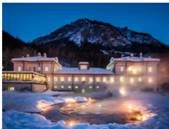
QC Terme Monte Bianco

In Val Fiscalina al Bad Moos-Dolomites Spa Resort di Sesto ( badmoos.it ), in Val Fiscalina, la stagione 2019/20 inizia con lo sconto grazie al pacchetto “Settimane speciali in inverno” . L’offerta, valida dal 5 al 22 dicembre 2019 e poi dal 5 gennaio al 16 febbraio 2020 , e dal 1 marzo al 14 aprile prevede uno sconto del 4% sul prezzo della camera che raddoppia qualora si arrivi di domenica o lunedì. La Dolomiti Super Première, valida dall’8 al 22 dicembre parte da 494 euro a persona in trattamento di mezza pensione in camera doppia (quattro giorni al posto di tre). Dalla struttura si può uscire già con gli sci ai piedi : gli impianti di risalita della Croda Rossa , appena fuori dall’hotel, permettono di godersi le piste, sempre ben preparate, del comprensorio sciistico Tre Cime Dolomiti . Complessivamente: cinque montagne collegate, 110 km di piste a innevamento garantito e di tutti i livelli di difficoltà, 31 moderni impianti di risalita . La stagione invernale 2019/20 presenta la nuova seggiovia a 8 posti Premium “Hasenköpfl” sul Monte Elmo, che sostituisce quella a tre posti e rende più confortevole la risalita oltrea ad aprirsi su uno dei panorami più spettacolari del comprensorio, con vista sulla Meridiana di Sesto .