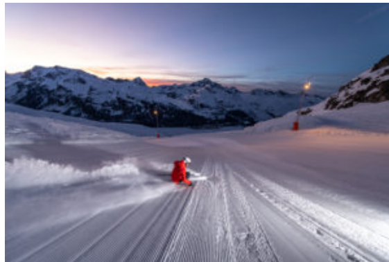
Sci in notturna sulle piste del Corvatsch a St Moritz

A Sant'Ambrogio, come da tradizione, si accende l'albero di Natale e prende ufficialmente il via la stagione degli sci e della neve, una stagione sempre più rivolta a un pubblico trasversale. Non solo amanti di sci e snowboard in tutte le loro declinazioni, ma anche sportivi da divano che apprezzano la dolce vita sulla neve oltre che e fan dell'adrenalina a caccia di novità sempre più emozionanti. Magari anche fuori dalle classiche rotte perché Cortina, Courmayeur e l'Alta Badia, tra gli altri, sono una garanzia ....ma si può anche sperimentare unendo, ad esempio, arte e sci in Iran grazie ai comprensori come Darbandsar sulle montagne Alborz a 60 km da Teheran o in sulla Sierra Nevada in Spagna dove le piste sono a 30 chilometri o facendo rotta verso Sud dove la pausa in rifugio è a base di arrostitincini o si può sciare guardando, all'orizzonte, il mare o i lapilli dell'Etna.