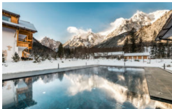
Bad Moos, sci, terme e piste adrenaliniche sotto le Tre Cime

A San Vigilio, vera e propria mecca dello sci, l' Excelsior Dolomites Life Resort ( myexcelsior.com ) dal 5 al 20 dicembre 2019, con l'offerta Dolomiti Super Première 4=3, propone pacchetti a partire da 492 euro in camera doppia comprensivi di quattro pernottamenti al prezzo di tre (o otto al prezzo di sei), con trattamento "Pensione Gourmet Plus" (ricca prima colazione, buffet wellness a pranzo, merenda con dolci e selezione di tisane e cena con 4 menu a scelta), 4 giorni di skipass al prezzo di 3, accesso diretto alle piste da sci del Plan de Corones e Sellaronda, deposito sci interno con scaldascarponi e armadietto personale. Settimanalmente l'hotel, dotato di una skiroom con diretto accesso ai tracciati di Plan de Corones, organizza ciaspolate guidate, gita guidata con lo slittino, skisafari, gara di sci per grandi e piccini, festa con vin brulè e fiaccolata sugli sci. Il resort ha inaugurato lo scorso anno stanze d'autore, ideali per rilassarsi dopo le giornate sulla neve delle Dolomiti. Si tratta delle 16 camere deluxe e suite dell'Excelsior Dolomites Lodge, con la Dolomites Sky Spa per adulti di 500 mq e infinity pool con acqua a 32° sul rooftop. Le grandi pareti di vetro annullano la distanza tra interno ed esterno, con la sensazione di essere avvolti dalle cime dolomitiche innevate. C'è inoltre l'Outdoor Relax Lounge con caminetto e TV sport, un' ampia sauna panoramica, Forest la sauna a raggi infrarossi, terrazza Fanes, Dolomites Indoor Relax Room e spa Lounge.