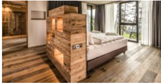
My Arbor, un hotel tra gli alberi per sciare sulle piste di Plose (Bressanone)

Sulle Dolomiti, tradizionalmente, la stagione parte con una formula davvero ghiotta valida fino al 21 dicembre: una giornata di soggiorno, sci sui 1200 chilometri del Dolomiti Superski e noleggio attrezzatura in omaggio oggi quattro, oppure otto giorni al prezzo di sei.