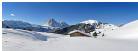
Foto Panorama-Seceda

Bardonecchia; le zipline da vertigine dove provare a “volare” sull’intero territorio imbragati a cavi d’acciaio (come la Skyfly di Ischgl che permette di tornare a valle volando a 50 metri di altezza e con una velocità che arriva fino agli 84 chilometri o la zipline di a Limone in Piemonte dove si corre su un percorso di 2410 metri con un dislivello di 560); le proposte di snowkite (farsi guidare, sci ai piedi, da un aquilone in genere su un altipiano come quello di Campo Imperatore) o di snowfer (farsi guidare da una vela su un lago ghiacciato); fughe a cavallo nelle foreste del Parco naturale Adamello Brenta o in heliski al Colle del Lys per poi provare l’ebrezza di circumnavigare il Monte Rosa.