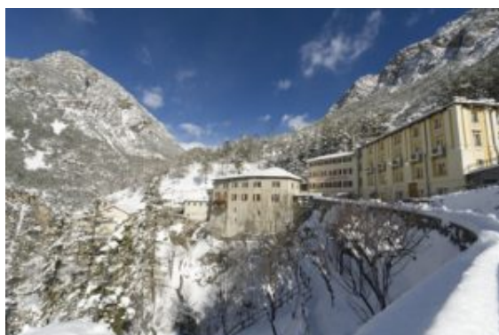
QC Terme Bormio Bagni Vecchi, per una pausa dopo lo sci

DOLCE VITA IN QUOTA Non mancano gli appuntamenti all'insegna della Dolce Vita, dall'alta cucina, alle degustazioni guidate, fino alla musica passando da centri termali sempre più emozionanti come i Qc Terme della Val di Fassa, di Près Saint Didier/Courmayeur e Bormio o l' AquaDome un universo con 11 piscine termali comprese tre esterne simili a coppe di champagne a pochi di chilometri di distanza da Soelden, le piste di 007.