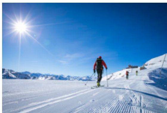
Sci di fondo a Courchevel

SKYFLY, SNOWFER E SLEGD OG Ecco quindi che accanto alle classiche discipline della neve si affiancano corse nei boschi su una slitta trainata da una muta di cani come la Grande Odyssée Savoie Mont Blanc che a gennaio, per sette giorni, attraversa 750 chilometri e 22 località tra Savoia e Alta Savoia o fughe nella neve a bordo di una fat bike, magari elettrica per fare meno fatica.