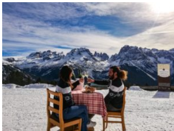
Trentodoc & Sci

la sua inconfondibile forma a cono si staglia nitida già dal Continente, dallo Scilla e Cariddi, o, e si preferisce, dallo stretto di Messina. Sul vulcano attivo più alto d'Europa, a 150 chilometri dalla costa dell'Africa, si scia guardando il mare in ben due aree che offrono anche anelli da fondo e itinerari per sci d'alpinismo, un'esperienza quasi unica.