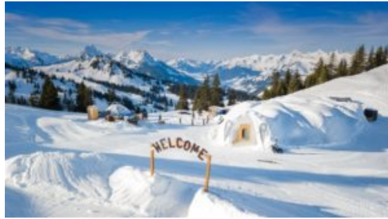
Igloo a Gstaad

L'alta cucina in quota ha un indirizzo ben preciso anche se in quasi tutte le località più glamour delle Alpi oramai vanno di moda festival dedicati a un pubblico gourmet. L'Alta Badia è meta d'elezione: qui infatti vi è il più alto numero di cucine stellate in quota. E, proprio in questi luoghi, l'inizio della stagione è celebrato con la gara di Coppa del Mondo sulla pista della Gran Risa a La Villa. Qui, sulla finish line dell'evento, Leitner Ropeways apre le porte (dal 21 al 23 dicembre) a una lounge dove chef stellati e promesse emergenti si alternano ai fornelli per i tre giorni. Da non perdere anche 0 l'edizione invernale del Trentodoc sulle Dolomiti che, a febbraio (13-16 a Madonna di Campiglio e 20-23 Val di Fassa), coinvolge le 54 cantine di bollicine di montagna associate all'Istituto.